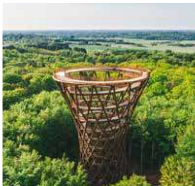
SKOVTÅRNET, EFFEKT ARKITEKTER